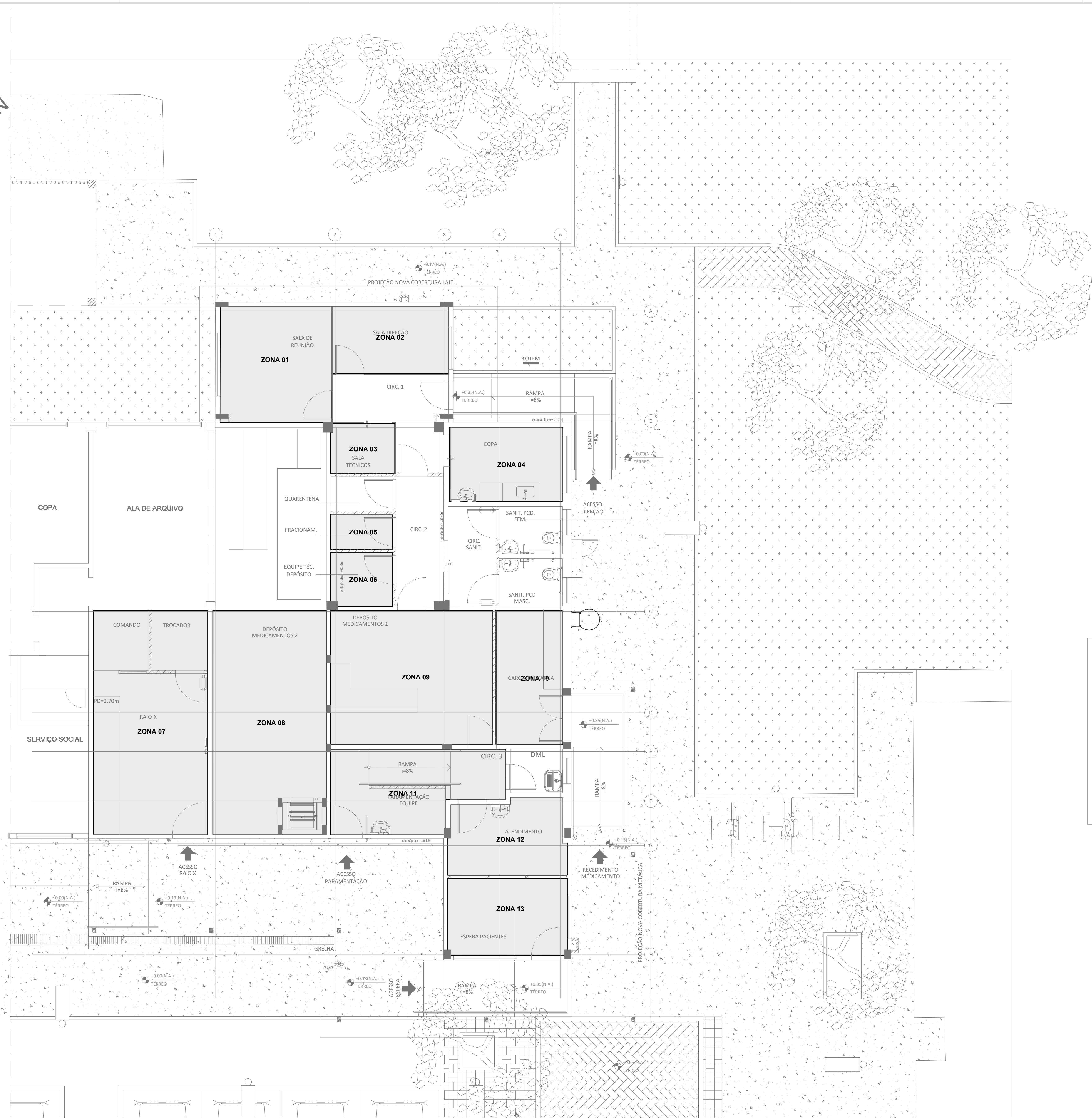
1 PLANTA BAIXA PAVIMENTO TERREO ESCALA 1/50